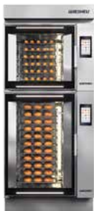
E3 SL z systemem załadowniczym